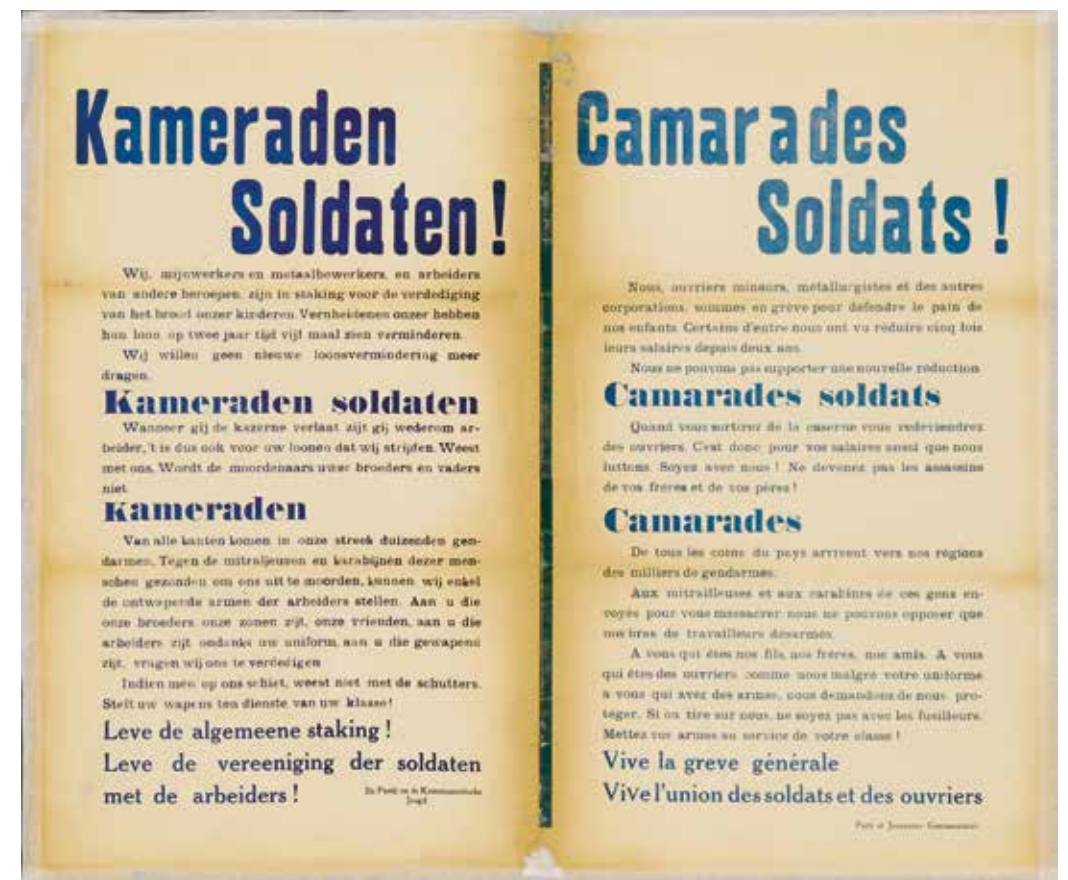
Affiche uitgegeven in 1932 door de Kommunistische Partij van België en de Kommunistische Jeugd van België voor solidariteit met de mijnwerkers in de Borinage.